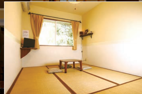
2名までの畳のお部屋