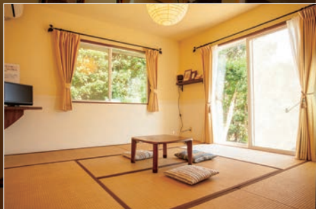
4名までの畳のお部屋