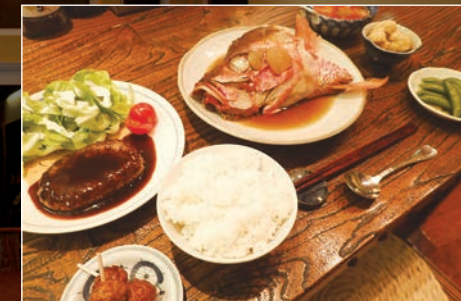
島の食材を活かしたアレンジ料理